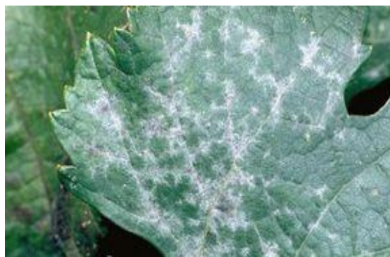
Μέτρια (εμφανείς αρκετές κηλίδες προσβολής, συνήθως περιορισμένες σε διάμετρο 2-5 εκατ)