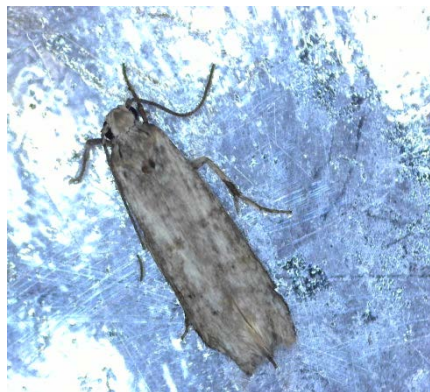
Πυρηνοτρήτης ( Prays oleae )