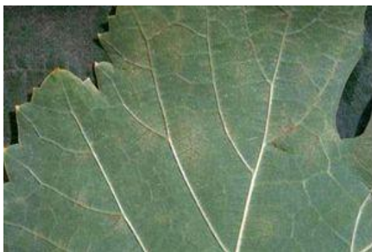
Ίχνη (ελάχιστες κηλίδες προσβολής ή κανένα σύμπτωμα, ούτε μυκήλιο ούτε ορατή καρποφορία του μύκητα, μόνο ένα μικρό κατσάρωμα του ελάσματος)