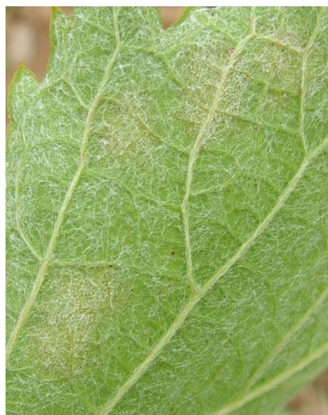
Επάνθιση (καρποφορία του μύκητα) στην κάτω επιφάνεια του φύλλου