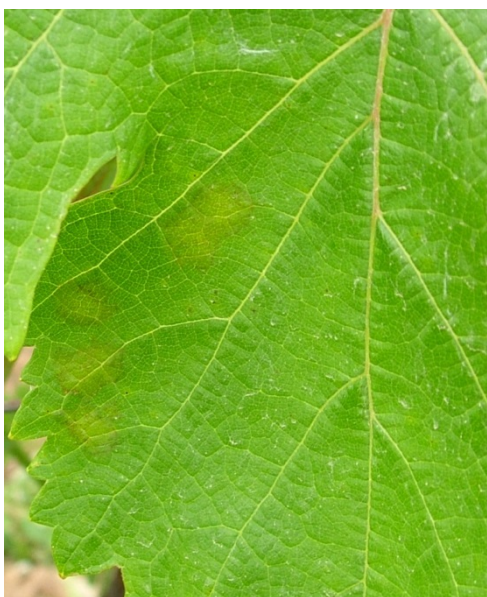
Κηλίδες λαδιού στην πάνω επιφάνεια του φύλλου